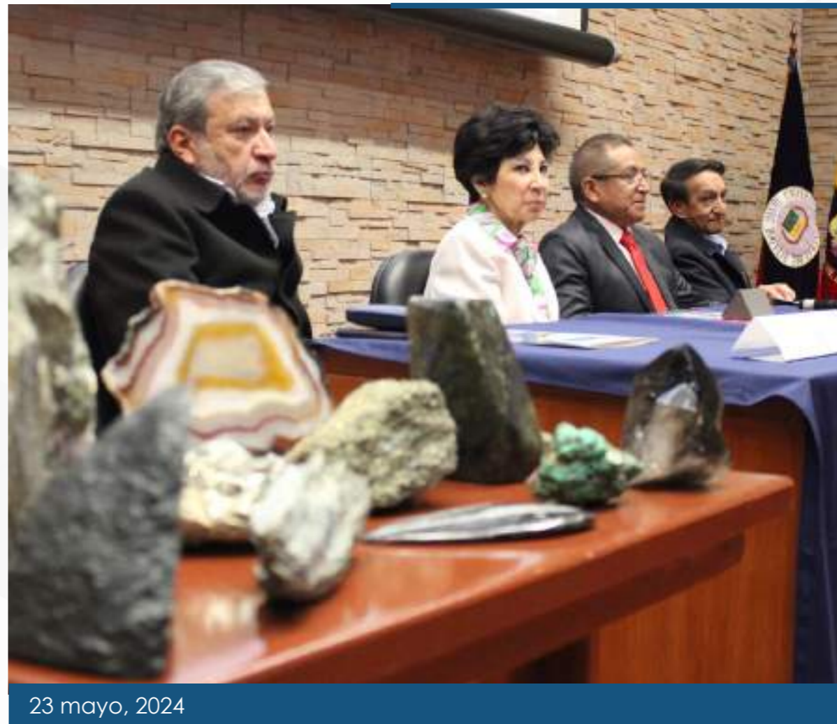
23 mayo, 2024

Fue organizado por el Museo de Ciencias de la Tierra en conjunto con UNESCO y el Proyecto Geoparque Bosque Petrificado Puyango. Reunió a investigadores de la Universidad Autónoma de México; Red Latinoamericana de Geoparque; Instituto de Investigación Geológico y Energético de Ecuador, Sistema Integrado de Museos y Herbarios – UCE; Escuela Politécnica Nacional y Universidad Regional Amazónica Ikiam.