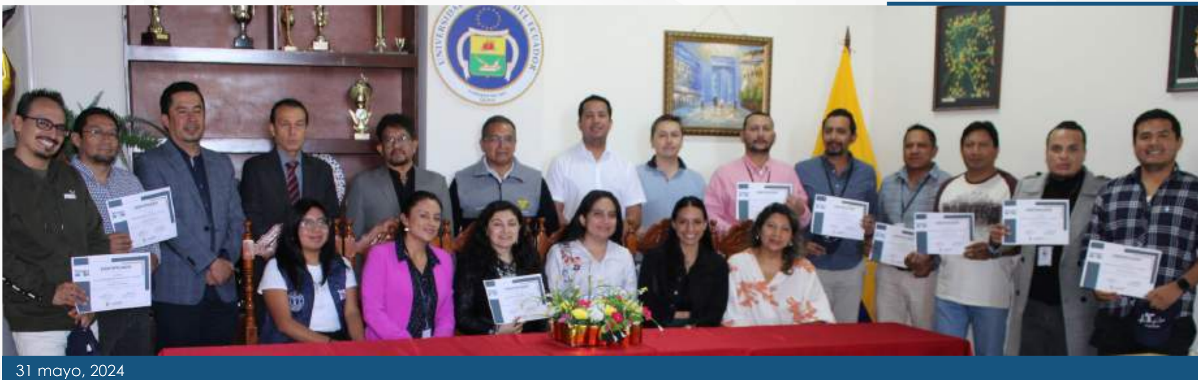
31 mayo, 2024

El curso de Geología y Reservorios fue impartido por la Compañía Geo Energy & Oil Strategic Advisors en conjunto con la FIGEMPA, en el marco del convenio de cooperación interinstitucional, dirigido a veinte funcionarios de la empresa EP Petroecuador desde el 27 al 31 de mayo de 2024. El decano de la facultad destacó la importancia de fortalecer los conocimientos, así como su aplicación en el ámbito laboral.