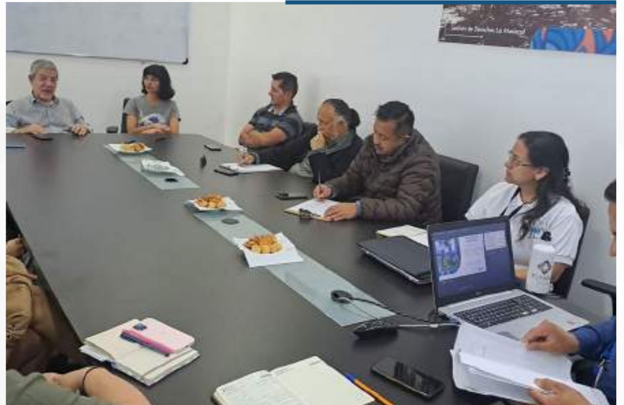
22 mayo, 2024

En el marco del día del árbol que se conmemora en el Ecuador el 22 de mayo de cada año, la FIGEMPA continúa implementando el proyecto de vinculación denominado “Arbolado Urbano y su impacto ambiental” que busca como uno de los primeros hitos “Caracterizar el arbolado Urbano en la parroquia Mariscal Sucre del Distrito Metropolitano de Quito”.