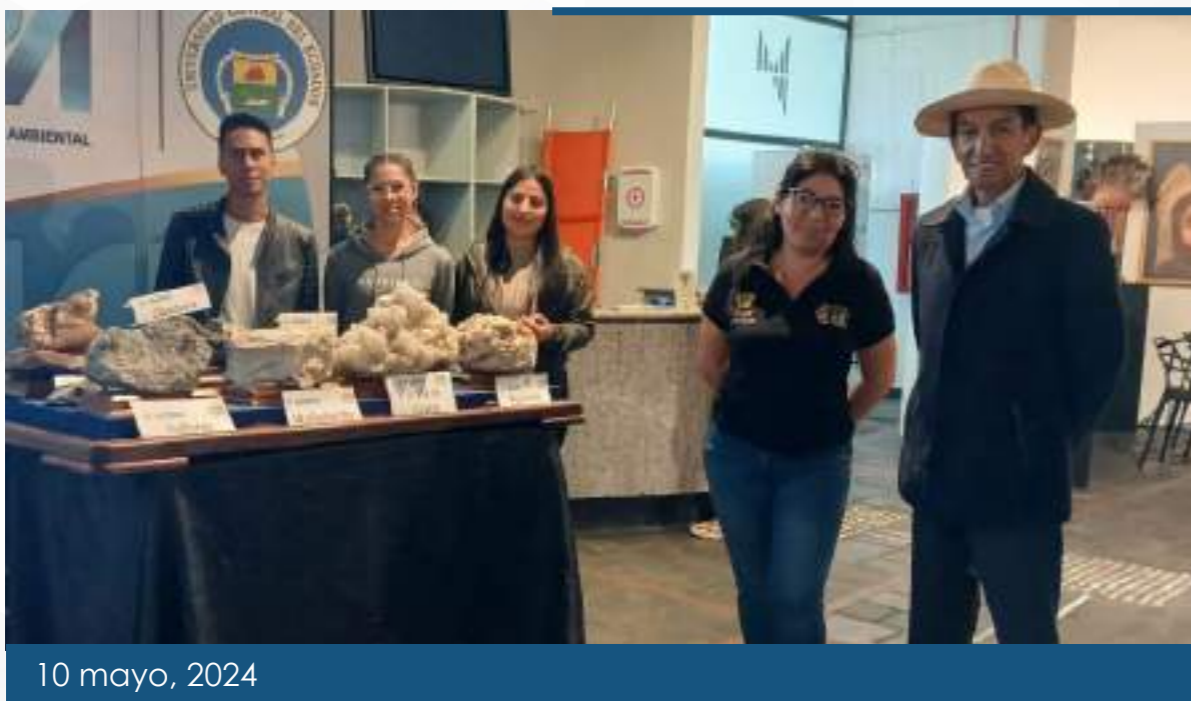
10 mayo, 2024

D urante la celebración del Día Internacional de los Museos, el Museo de Ciencias de la Tierra participó en una feria organizada por el SMQ y la Red de Museos del Centro Histórico. En nuestro stand, destacamos nuestras actividades educativas e investigativas, enfatizando la importancia de la educación en las ciencias de la tierra y la relevancia de la investigación para el conocimiento y la preservación de nuestro planeta.