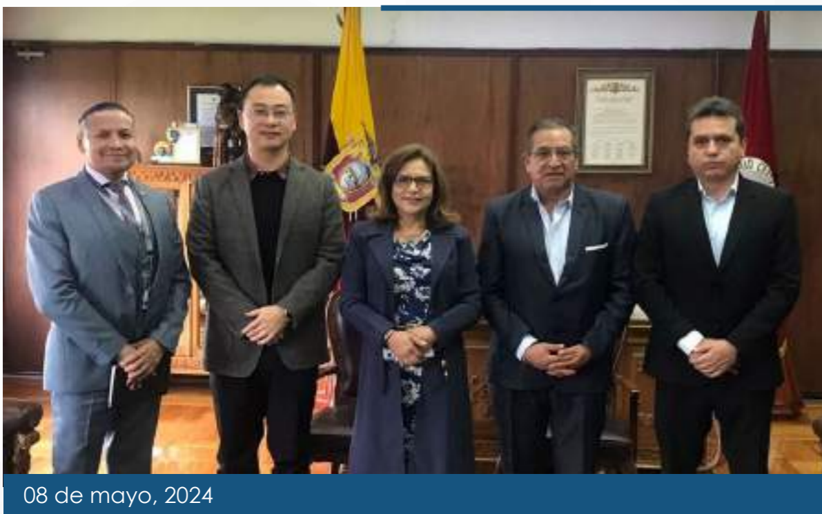
08 de mayo, 2024