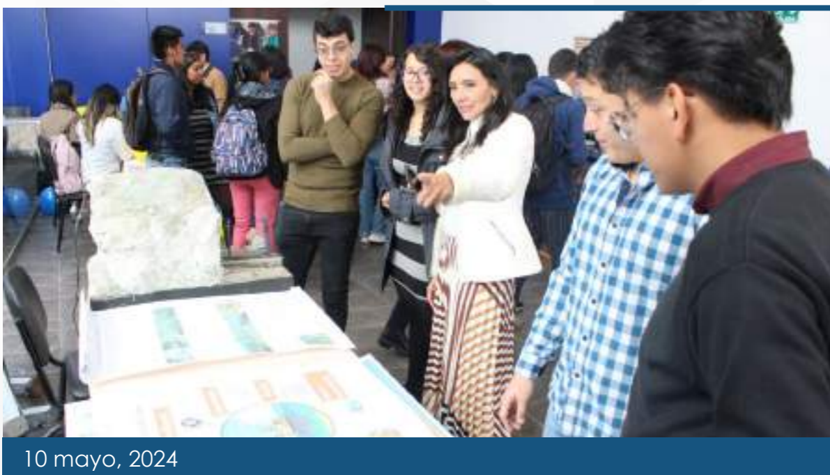
10 mayo, 2024

El Proyecto de Difusión de Ciencias de la Tierra destacó en las exposiciones de inauguración de los proyectos de vinculación, organizadas por la Dirección encargada de estas actividades en el auditorio del Centro de Información Integral de la universidad. Los estudiantes y docentes ofrecieron información a los asistentes promoviendo el interés por las Ciencias de la Tierra.