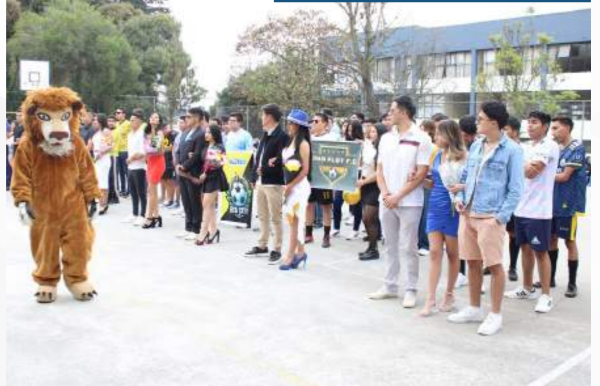
23 mayo, 2024

E studiantes de todos los semestres participaron en este evento deportivo, organizado por la Asociación de estudiantes. La práctica del deporte competitivo desarrolla en los participantes la disciplina, el compromiso, el trabajo en equipo y fortalece el sentido de pertenencia. El decano destacó la importancia del deporte en el desarrollo integral de los estudiantes.