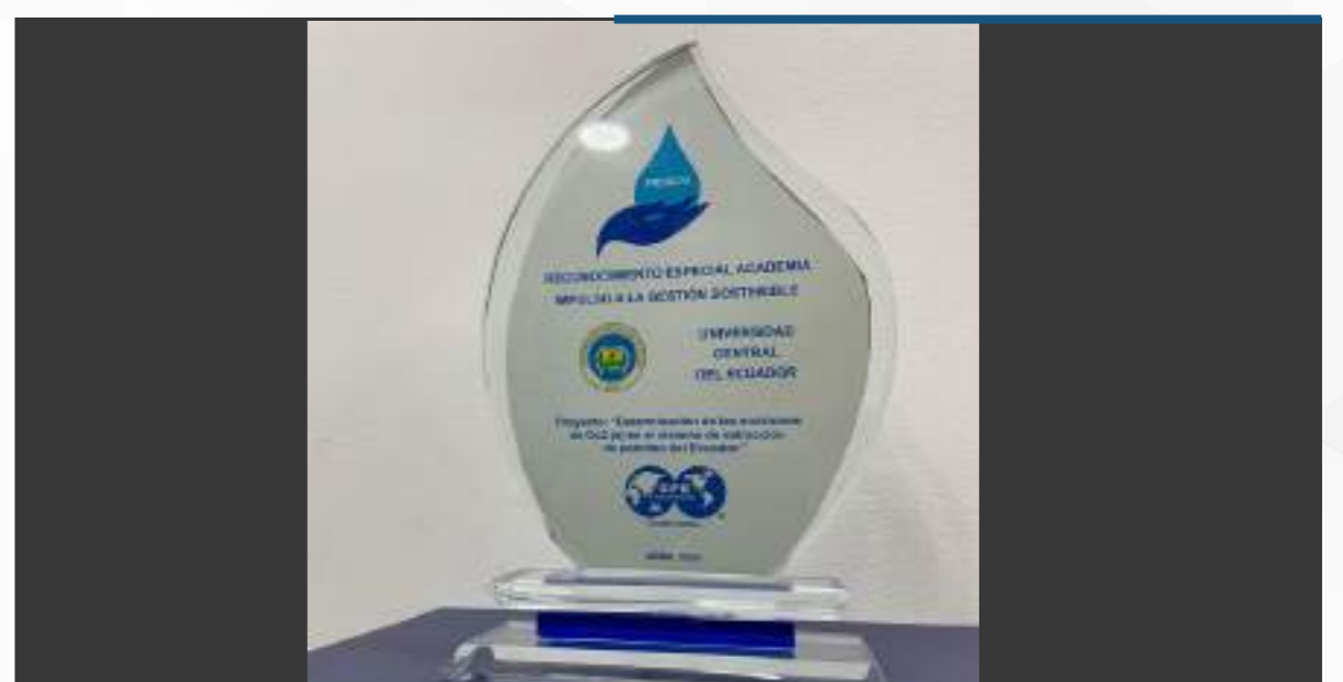
01 mayo, 2024

Un proyecto de investigación del Instituto de Investigaciones Hidrocarburíferas con la participación de docentes y estudiantes de Petróleos, permitió que la Universidad Central del Ecuador obtenga un reconocimiento especial en los Premios GAIA 2024. Este evento realizado por la SPE Ecuador Section, tiene como objetivo reconocer y celebrar los logros de actores en la industria petrolera que han adoptado prácticas sostenibles con responsabilidad ambiental.