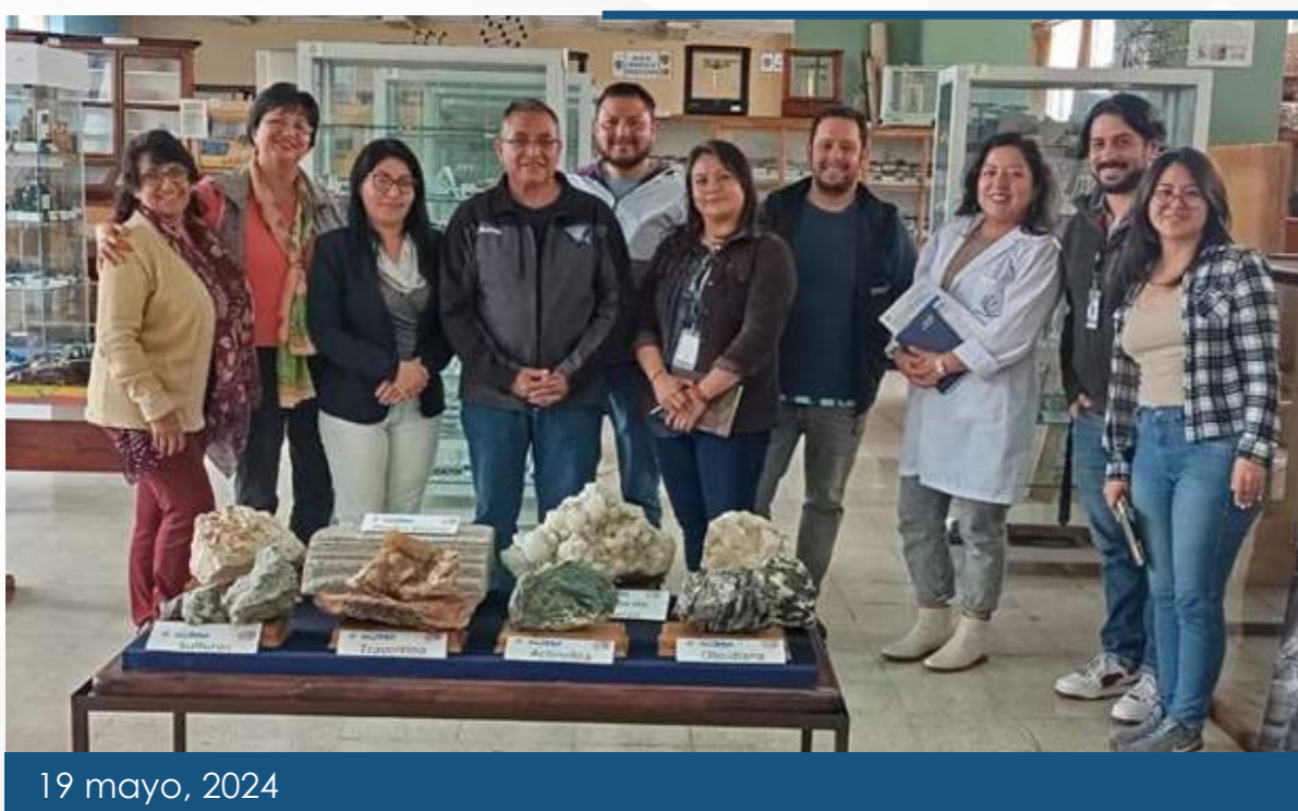
19 mayo, 2024

S e realizó una reunión preparatoria entre el Sistema de Museos y Herbarios, el Archivo de la Universidad Central y la FIGEMPA para iniciar con las gestiones por el aniversario de la facultad. Se establecieron las bases y acciones a tomar para conmemorar de manera especial esta fecha, que resalten la importancia y el legado de la facultad en la comunidad académica y en la sociedad en general.