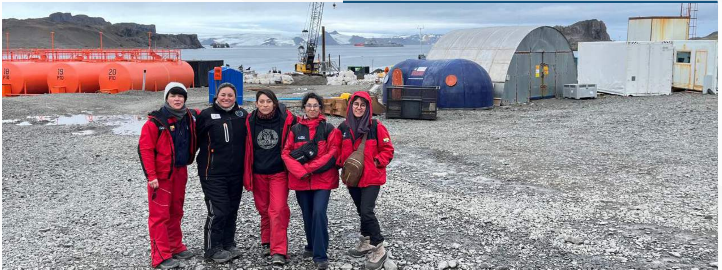
06 marzo, 2026

Además, trabajan en un proyecto orientado a la búsqueda de microorganismos productores de nuevos antibióticos en suelos de la Antártida, contribuyendo así al avance del conocimiento científico y la innovación.