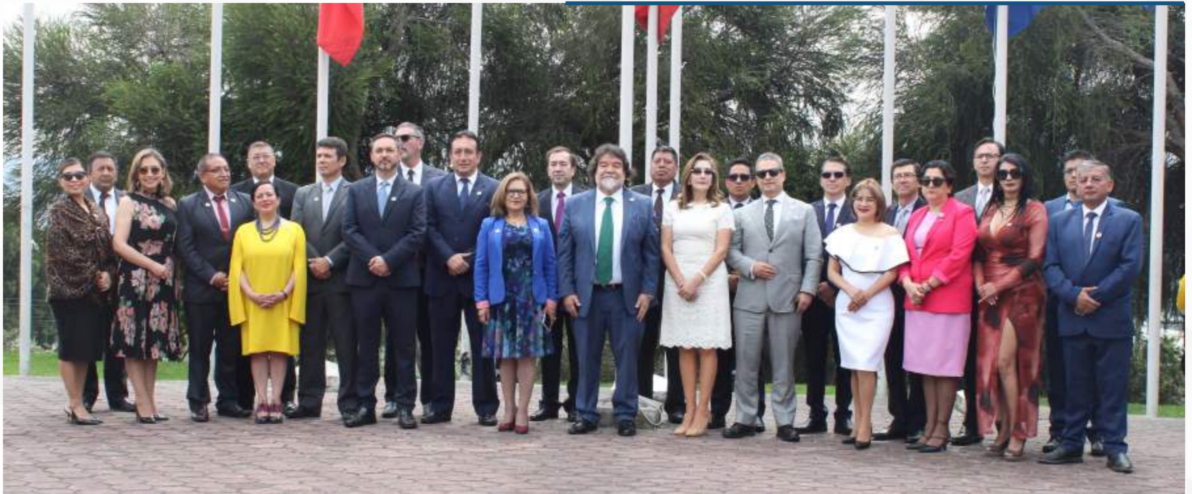
17 marzo, 2026

Además, la ceremonia contó con la participación de la banda de la Policía Nacional, que interpretó las notas del Himno Nacional del Ecuador y del Himno de la Universidad Central del Ecuador, acompañando este acto solemne.