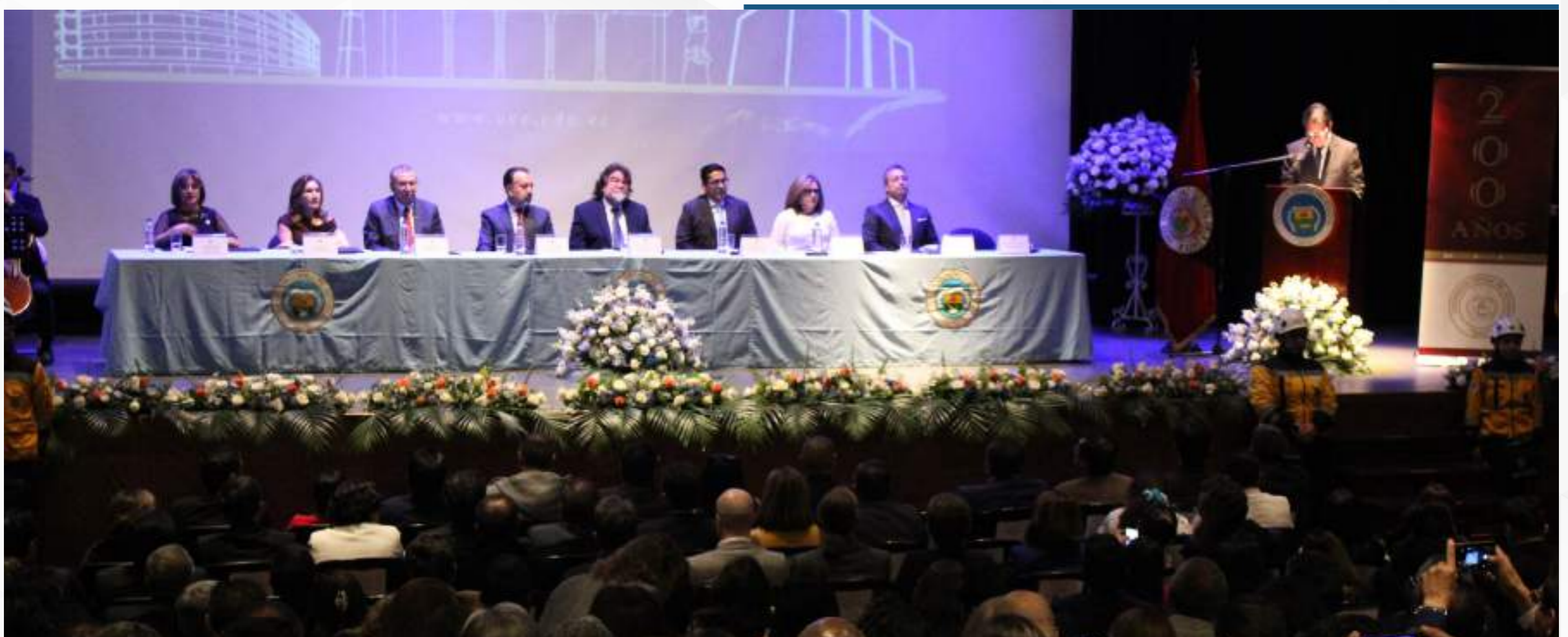
18 marzo, 2026

Felicitamos la valiosa labor de todos quienes forman parte de la Universidad Central, y que, con su compromiso y dedicación, son el motor que impulsa el crecimiento y la excelencia de esta gran institución.