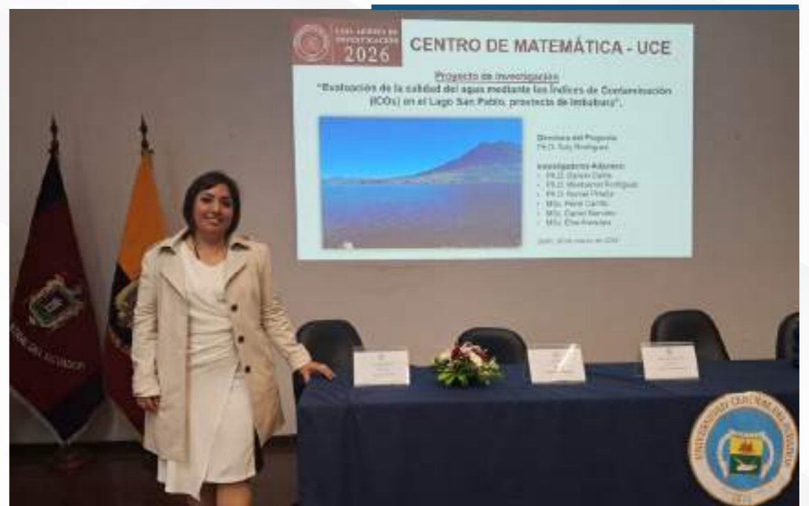
26 marzo, 2026

Este estudio aporta al análisis y monitoreo ambiental de uno de los cuerpos de agua más representativos de la región, generando información clave para impulsar acciones de conservación y uso sostenible.