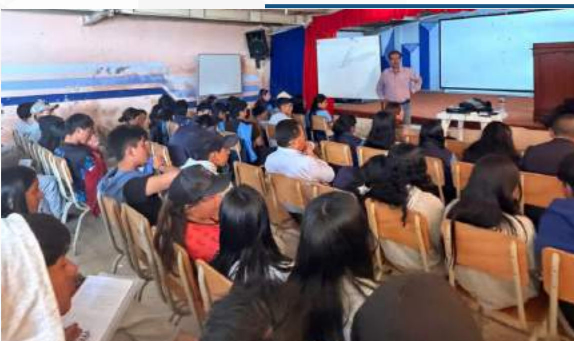
26 marzo, 2026

Agradecemos al GAD Parroquial de Sibambe por la invitación y por generar estos espacios de articulación entre la academia y la comunidad.