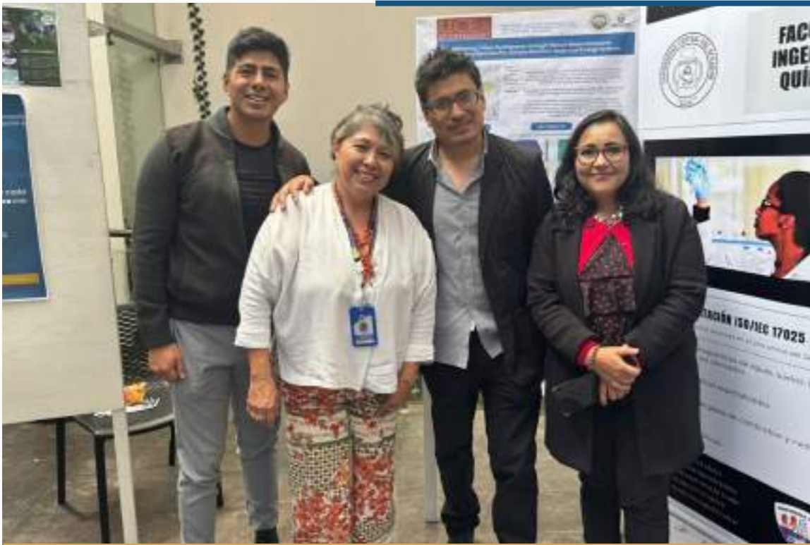
06 marzo, 2026

En el marco de las actividades conmemorativas por el Bicentenario de la Universidad Central del Ecuador, es un gusto indicar que nos han invitado a participar en la Feria de Pósters de Investigación, donde se está presentando el trabajo que venimos desarrollando juntamente con la Facultad de Ingeniería Química y FIGEMPA, dentro de las actividades del Proyecto Economía circular en los reservorios hidroeléctricos del Ecuador: Caracterización y aprovechamiento de sedimentos.