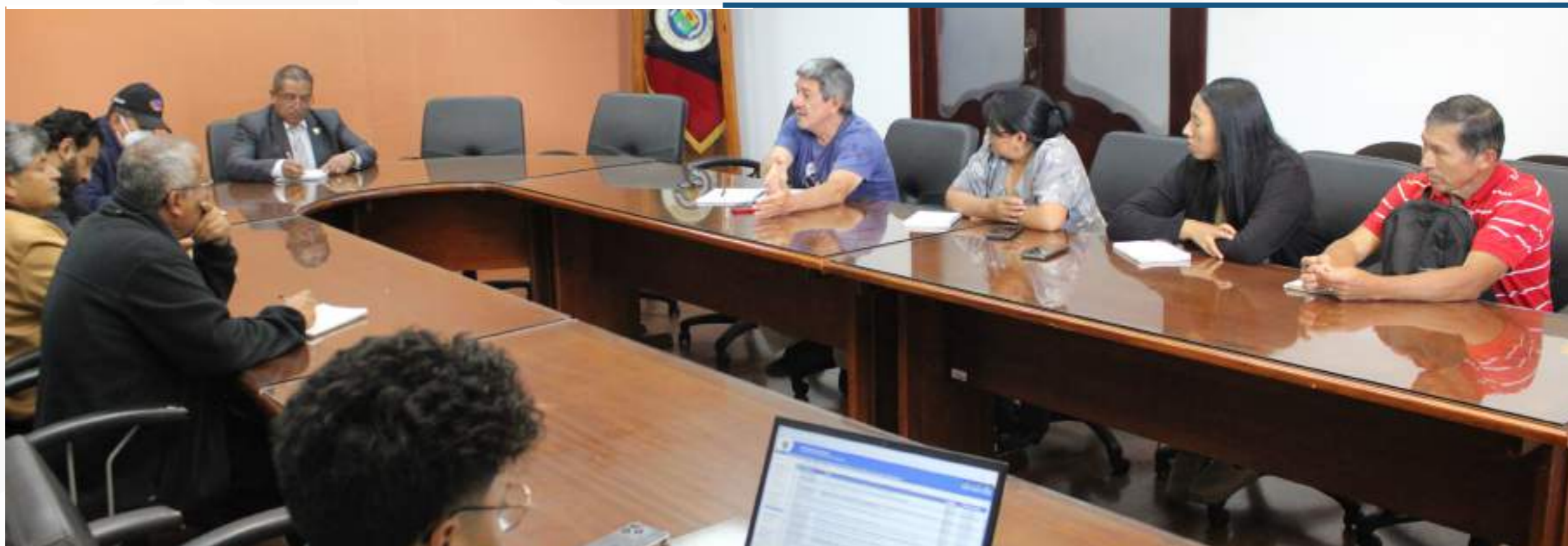
30 marzo, 2026