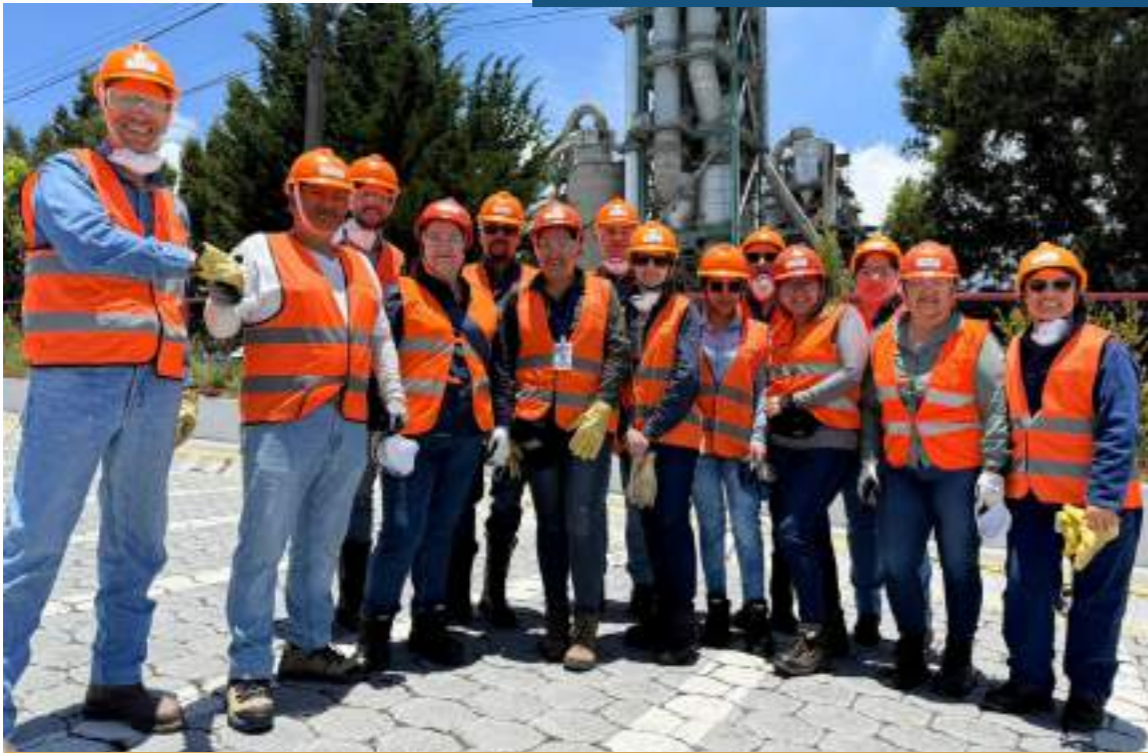
25 marzo, 2026

El pasado 25 de marzo de 2026, estudiantes de la Carrera de Minas realizó una salida de campo en Imbabura, donde se fortaleció conocimientos técnicos directamente en el entorno real.