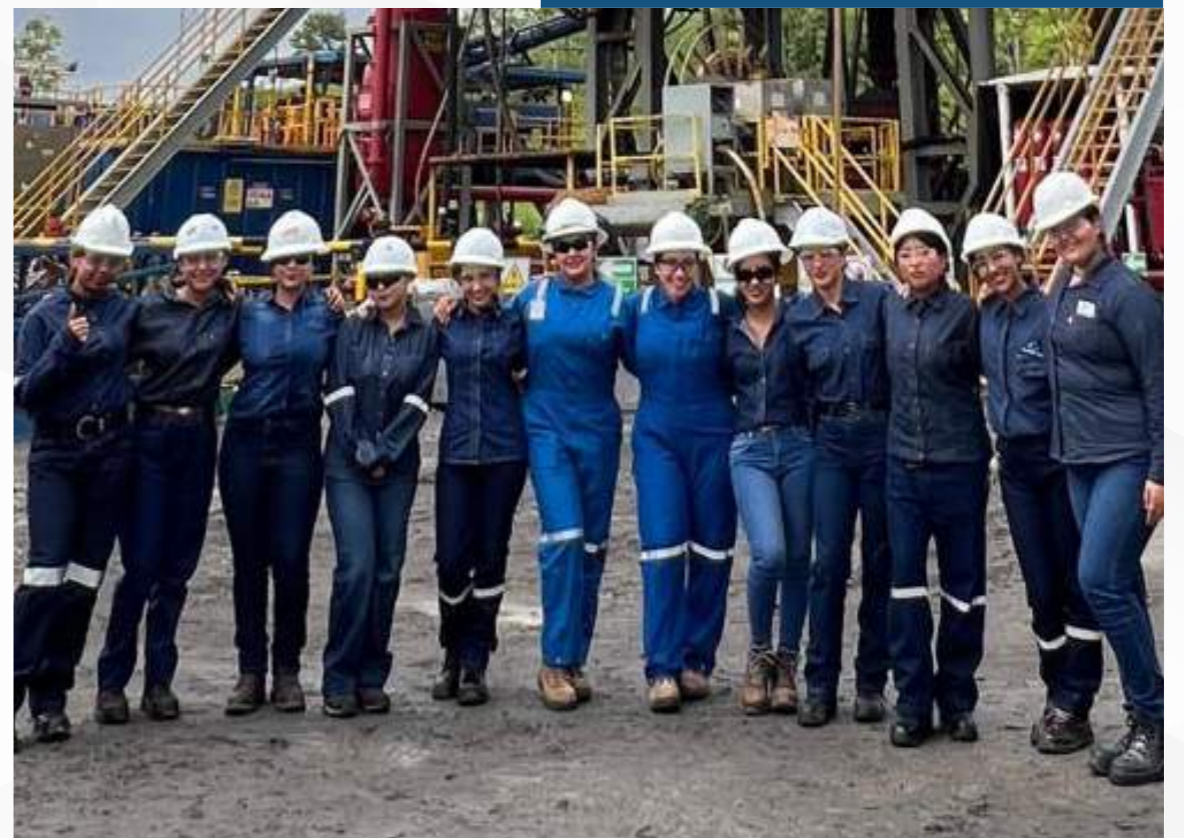
06 marzo, 2026

FIGEMPA agradece de manera especial a Petroecuador Consorcio Shaya por su compromiso con el desarrollo académico de nuestros estudiantes.