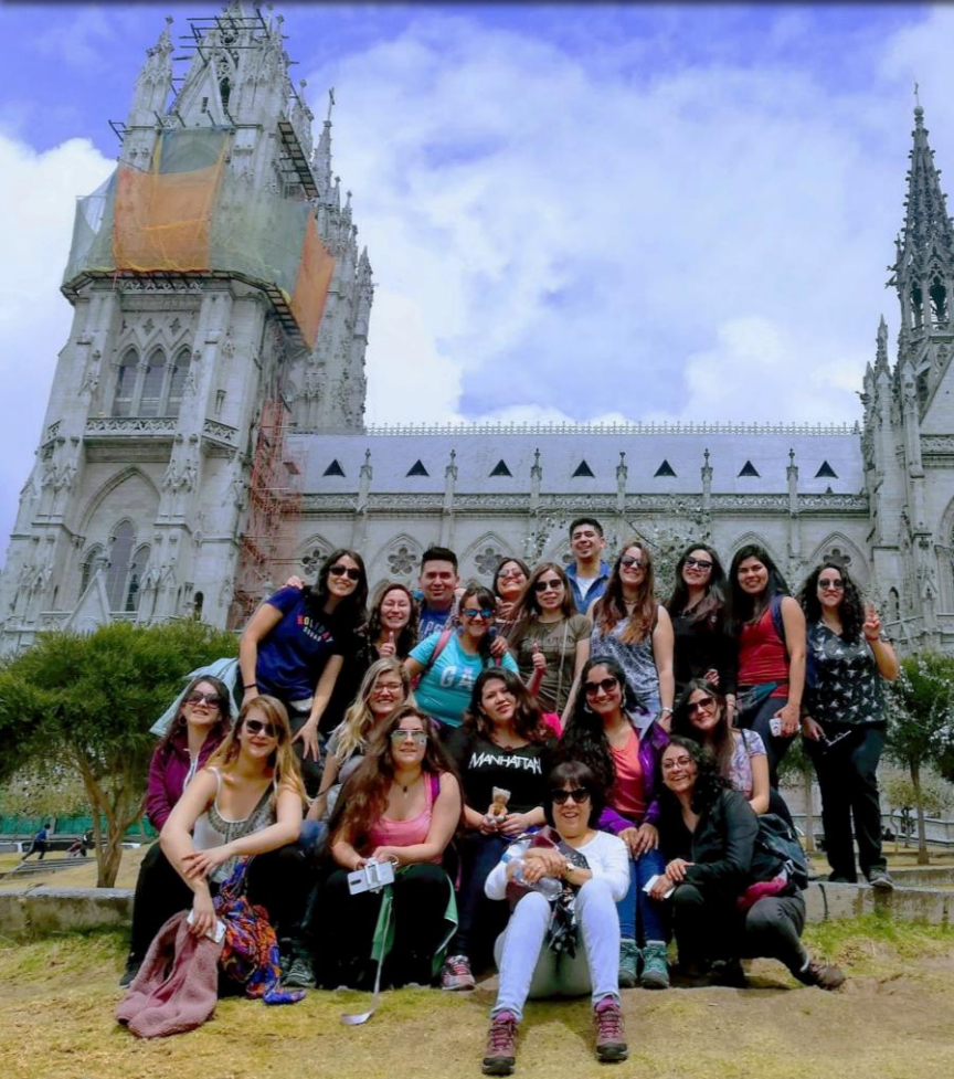
Incremento de estudiantes de Intercambios semestrales 2015-2019